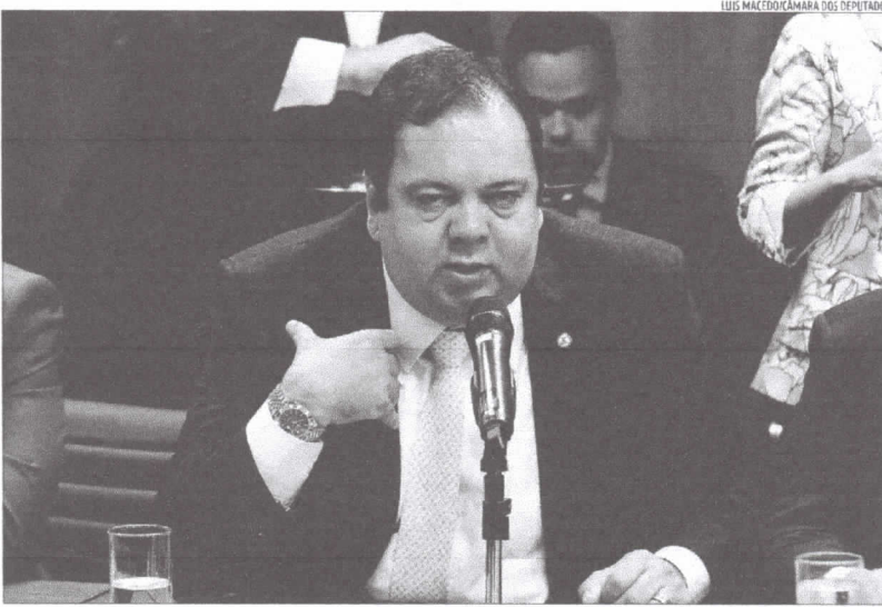
Deputado federal Elmar Nascimento destaca que maior bancada tem direito de escolha na Comissão de Constituição e Justiça

A CMO deve ser instalada em breve, a partir de março, e decidirá, por exemplo, o destino das verbas federais, com a votação das regras e dos valores do Orçamento que ficam na mão do Executivo, além das emendas parlamentares, aquelas carimbadas por deputados e senadores.